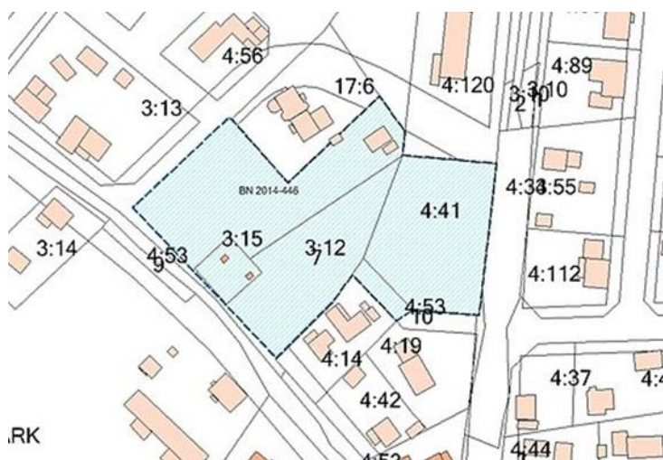
Plankarta över området där F-3 skolan ska byggas.